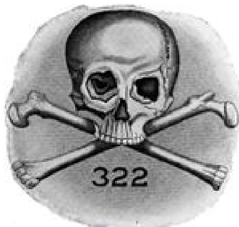
スカル・アンド・ボーンズのエンブレム

従来、アメリカの政界を牛耳っていたのはハーバード大学卒ですが、最近ではブッシュ親子、クリントン夫妻、ケリー元大統領候補、チェイニー元副大統領など、エール大学派閥勢力が強くなってきました。