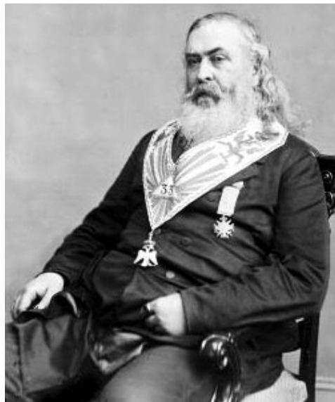
フリーメイソンの黒い教皇 アルバート・パイク (1809-1891)

何度も繰り返しますが、フリーメイソンは世界最大の秘密的結社ではありますが、何ら怪しいものではなく、あくまでも真理の追究、他の人々の尊厳と自由と権利を認め、自由・平等・博愛を実践してゆく団体です。