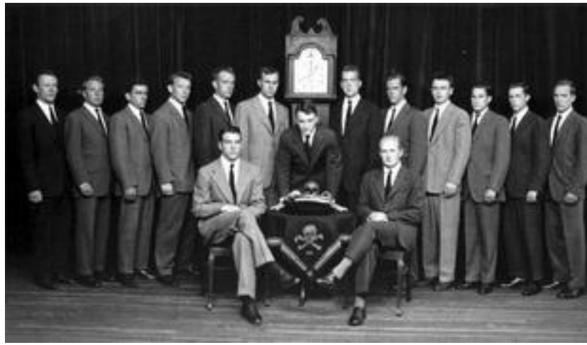
この写真は、S & B(スカル・アンド・ボーンズ)の 1947 年の集合写真です。ジョージ・H・W・ブッシュが時計の左にいるのが分かります。

S & B は、17 世紀末にオックスフォード大学のオール・ソウルズ・カレッジに設立されたフリーメーソン秘密結社に由来するものであり、エール大学内の秘密結社です。