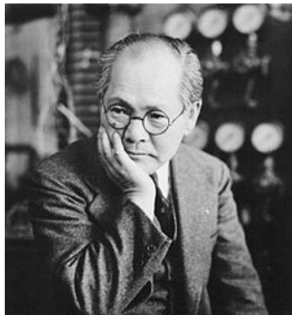
仁科芳雄 博士 (1890-1951)